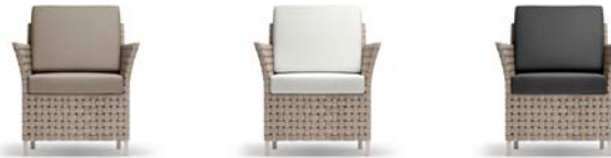
ラタン クッション