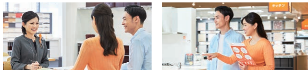
コーディネーターと一緒に見学